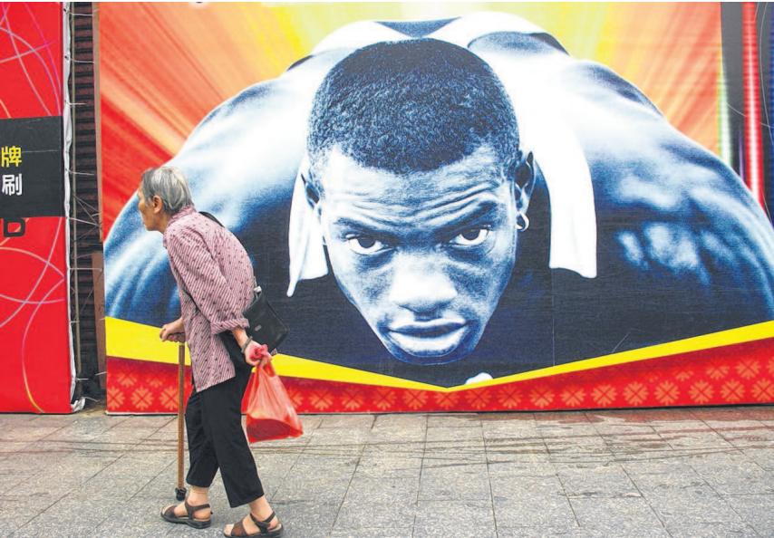
陈健新的作品《人生之旅》